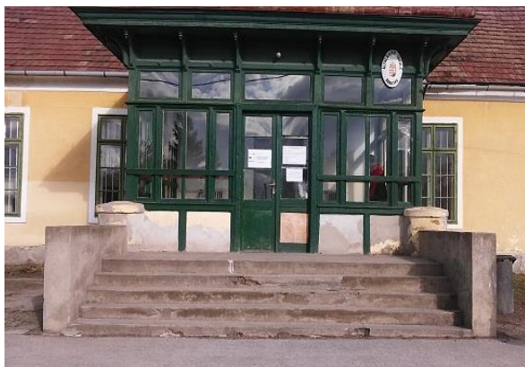
Legrégebbi épületrész (életveszélyessé nyilvánított)