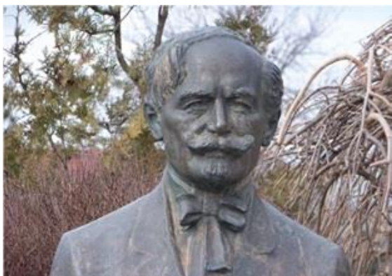
Kozma Ferenc szobra