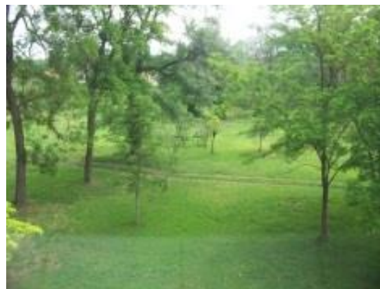
Iskola épület mögötti park