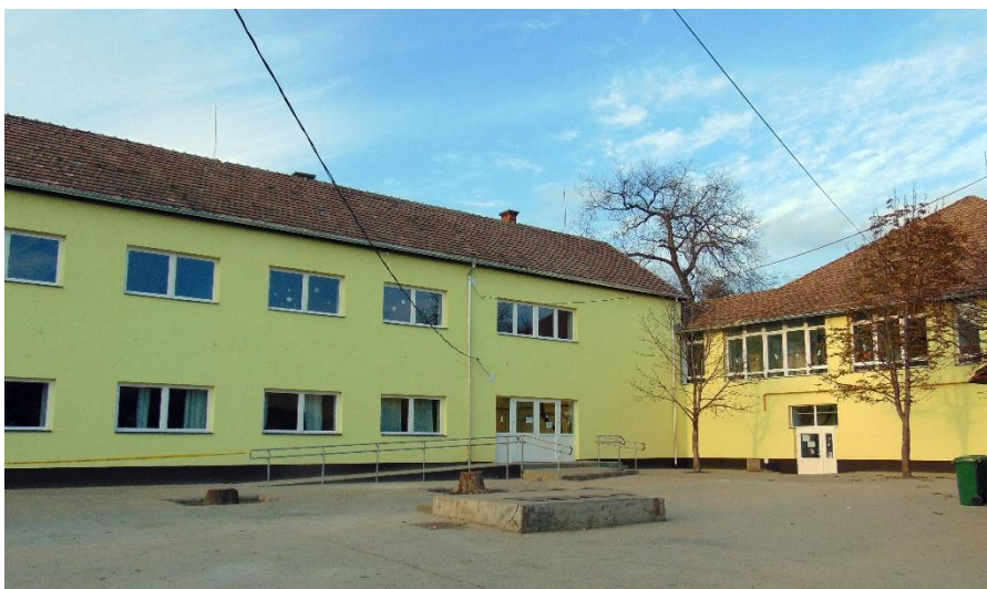
Felső tagozat épülete

A legrégebbi szárnyrész a század elején épült, 1997-ben került felújításra, jelenleg életveszélyesnek nyilvánítva, ahol 1 tornaszoba, 2 öltöző, 2 WC mosdóval, 1 technika terem volt. A másik két épület 1978-1991 között épült, melyet 2018 nyarán a Dunaújvárosi Tankerület részlegesen felújította. Bennük 12 tanterem 1 természettudományi szaktanterem (biológia-kémia-földrajz- fizika), 1 számítástechnika terem, 1 tanári szoba, 2 fejlesztő terem, 1 iskolai könyvtár olvasórésszel és irodahelyiségek találhatóak.